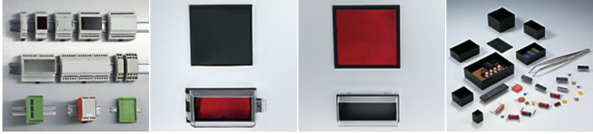
Railtec C Norm-Einbaugehäuse Typ A Norm-Einbaugehäuse Typ B Modul-Leergehäuse Duroplast