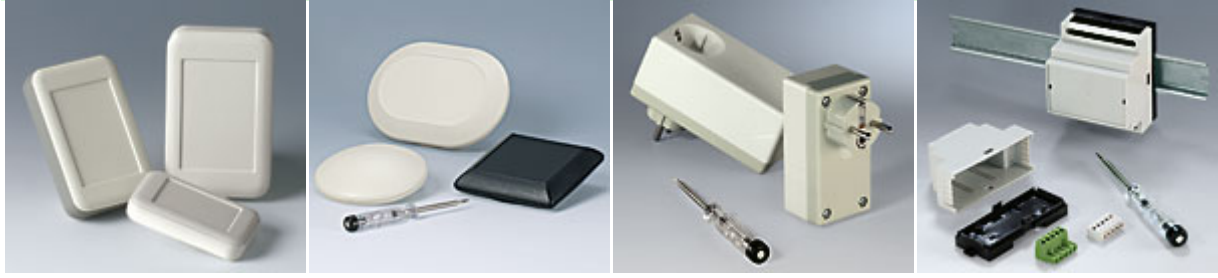
Soft-Case Art-Case Steckergehäuse Railtec B