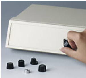
Drehknöpfe seidl. Befestigung