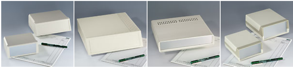
Motec Meditec Europa-Gehäuse Lux-Gehäuse